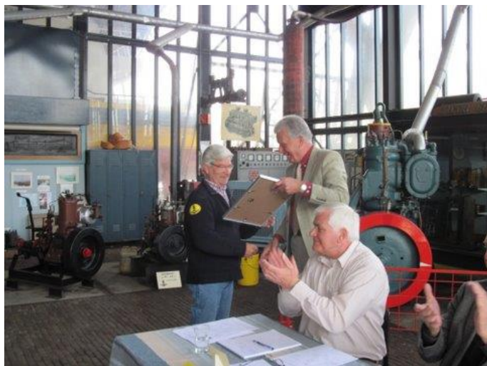
Han krijgt tijdens de jaarvergadering op 2 april jongstleden de ingelijste oorkonde van het erelidmaatschap van de Vereniging van Vrienden door de voorzitter overhandigd.

Dat dit erelidmaatschap niet iets is wat als aardigheidje verleend wordt blijkt wel uit het feit dat er in de ca. 40 jaar dat onze Vereniging bestaat slechts drie ereleden zijn benoemd.