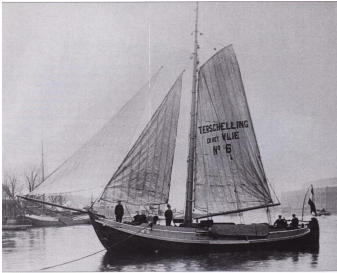
De botter in oorspronkelijke staat

nemen en bovendien bevoorrading verzorgen. Na dat enige jaren te hebben gedaan werden deze 'pendeldiensten' overgenomen door zeegaande motorschepen.