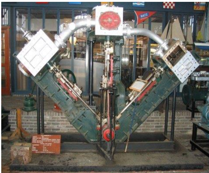
De bijzondere machine in ons museum

Ten behoeve van de tentoonstelling die verband houdt met het project 'Arnhemse Scheepsbouw Maatschappij 1889-1978' is de bij deze werf als eerste in ons land gebouwde diagonaal triple-expansie-stoommachine, die gewoonlijk in ons museum tentoongesteld is, tijdelijk aan Arnhem afgestaan. Daarvoor is door onze vrijwilligers het nodige aan voorbereidingen voor het transport verricht.