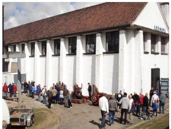
Er was geen gebrek aan belangstelling