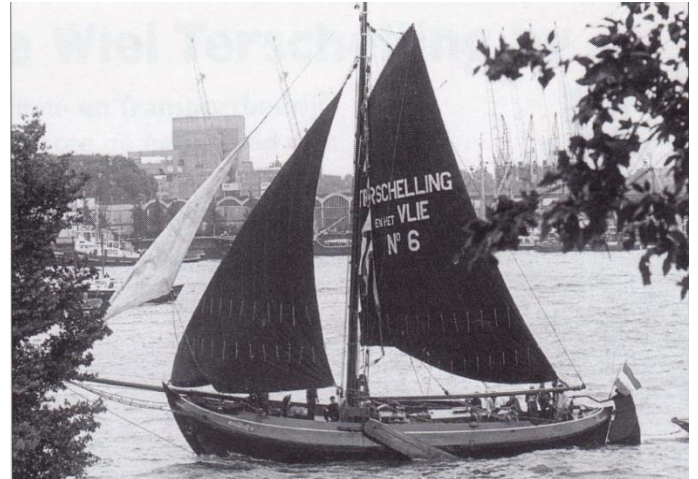
Tijdens Sail Amsterdam 1980

In 1960 werd de loodsbatter Albatros van de sterkte afgevoerd en kwam in particulier bezit. Tijdens Sail Amsterdam 1980 werd het nog gesignaleerd. Daarna verdween het voor lange tijd uit beeld.