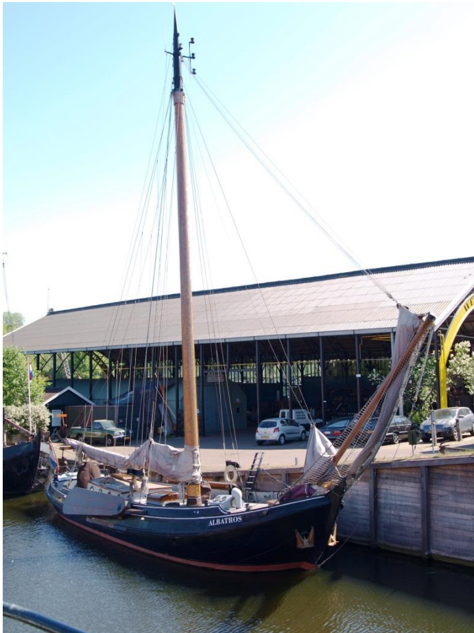
Zo is het nu te zien aan de Kromhoutwerf

Herstel en cosmetische ingrepen hebben het op de werf tot een herboren schip gemaakt.