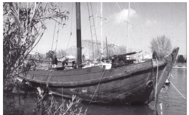
Zo werd het in Spanje aangetroffen >

Met grote inspanning, toepassing van enkele 'trucs', 'kunst en vliegwerk', is het bij de Werf 't Kromhout gearriveerd en in handen gekomen van de heren van Amerongen en van Empelen.