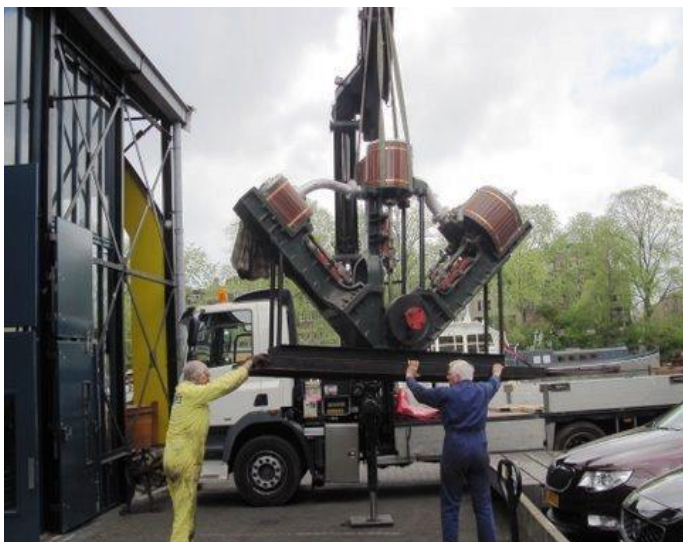
Door vaardige handen begeleid voor de reis naar het logeeraadres

Voor de verschillende objecten zoals motoren, stoommachines, werktuigen en dergelijke zijn nieuwe tekstborden gemaakt. Ingelijst en voorzien van foto's.