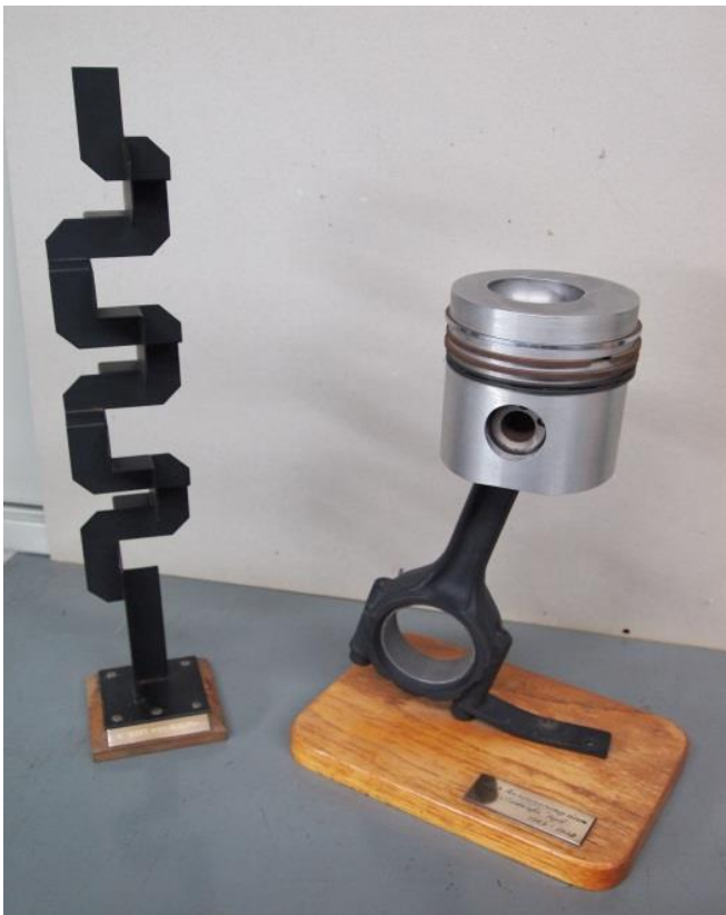
De fraaie modellen van Kromhoutproducten

Een noodstroomvoorziening nodig om de elektrisch aangedreven compressoren voor de grote dieselmotoren van Werkspoor, waarmee de pompen werden aangedreven, in ieder geval in werking te houden in geval er een stroomstoring zou optreden. Deze compressoren leverden de nodige inblaaslucht met een druk van ca. 55 atmosfeer of bar voor deze motoren. Inblaaslucht waarmee de brandstof op het juiste moment onder druk in iedere cilinder werd gebracht en verneveld. Als gevolg van de hoge temperatuur kwam dan de brandstof tot ontbranding, de druk nam aanzienlijk toe en de zuiger werd naar beneden gedreven. De arbeidslag in het viertakt-proces kwam tot stand.