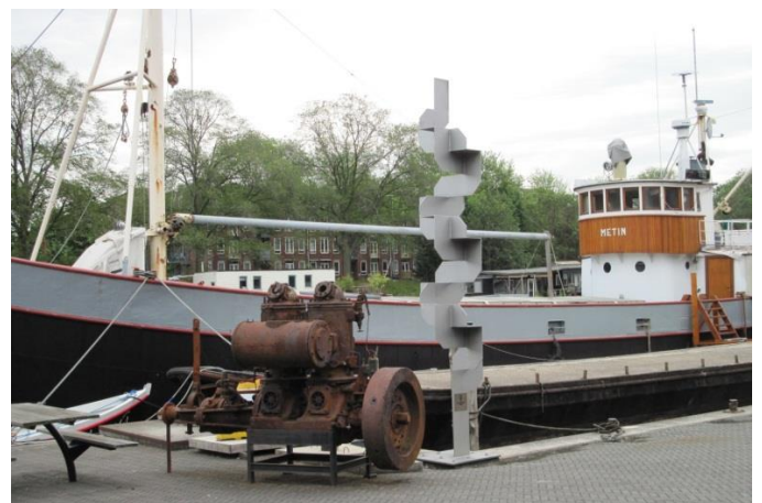
Een plaats op het terrein naast een ander monument

Na wat omzwervingen is het monument gered van de schroot en heeft 'n plek gekregen op het terrein van het museum Werf 't Kromhout.