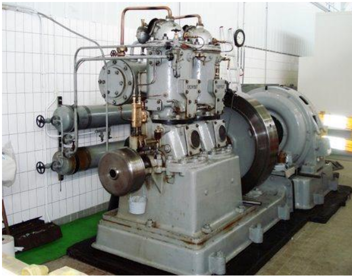
De Kromhout 2-ER-II, nu in goede staat

Met dank aan Han Mannaert (gegevens motor), Jaap Goedhart (verslagje en 2 foto's), de heren Mulder en Peek (hun inspanningen), de heer N.G.M. de Jong te Medemblik (foto's Werkspoor-motoren) en de heer Oud te Winkel die de foto uit de krant om niet beschikbaar stelde.