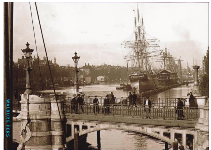
Toen van de Nieuwe Vaart naar Oosterdok gezien