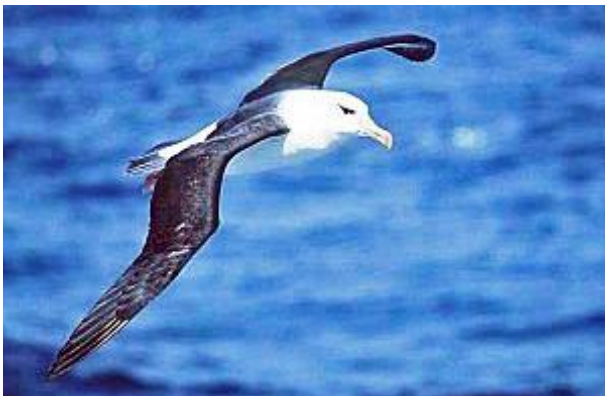
De imposante zeevogel Albatros

Genoemd naar de grote zeevogel met vleugels die een spanwijdte van 3 meter of meer hebben. Vogels die vrijwel hun hele leven boven zee doorbrengen. Zij kunnen op efficiënte wijze zwevend zeer grote afstanden afleggen daarbij gebruik makend van luchtstromen.