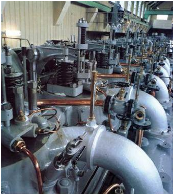
Zicht op de top, cilinderkoppen, van de Werkspoormotoren